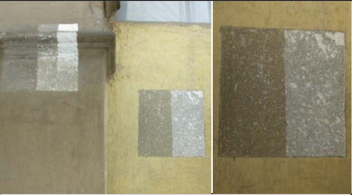
Tassello stratigrafico 7a