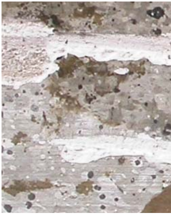
FIG. 4A-B-C (probabile finitura originale: strato 2 di color grigiastro (Gs))