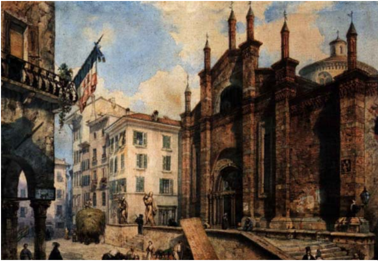
Brescia - Chiostri del Carmine piano terreno

Università degli Studi di Brescia (2001)